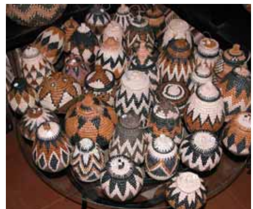
Artigianato zulu - cesti

Durban con le sue strade, le sue banche e i suoi grattacieli non dà più l’idea dell’Africa vista fin qui, sembra piuttosto il simbolo di una nazione avanzata che tende allo sviluppo sui modelli dei paesi occidentali.