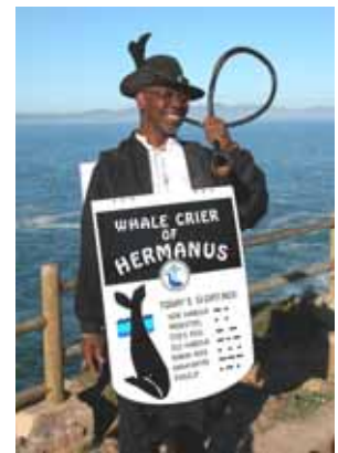
Lo strillone di Hermanus

L'emozione è forte quando, passeggiando sulla spiaggia, una grossa sagoma nera attira la nostra