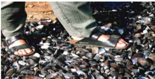
Mossel Bay - cozze

ha il “pavimento rotante” per permettere una visuale a 360° .