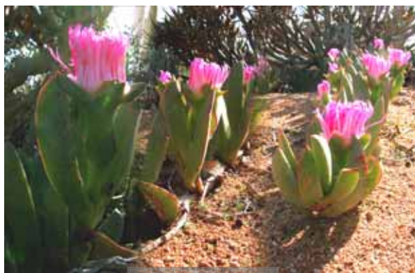
Succulente in fiore

Il Kruger National Park è uno dei più importanti ed estesi Parchi dell'Africa. E' bello e ricco di fauna, anche se le strade asfaltate e la segnaletica quasi autostradale anche sui sentieri, ne fanno perdere un po' lo spirito wild . La vegetazione è fitta e si fa fatica a vedere gli animali di cui il Parco è ricco. Noi siamo fortunati e vediamo in abbondanza "comuni" gnu, gazzelle e facoceri. Una iena mentre amorevolmente allatta i suoi piccoli ai bordi della tana, ci fa dimenticare la sua triste fama. Girando per tre giorni all' interno del Kruger incontriamo anche i grandi animali. Giraffe, ippopotami, elefanti e ben sei leoni al pasto: avevano appena catturato un bufalo. E poi rinoceronti che si aggirano tranquillamente fuori dal bush .