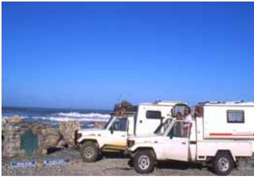
Cape Agulhas Diaz Point

La strada panoramica T1 che va verso Alexandria è un susseguirsi di fiumi, baie, e splendide insenature, a Malgas attraversiamo un corso d'acqua sull'ultimo traghetto a trazione umana ancora esistente. Intorno colline verdi, tutte a pascolo, degradanti verso il mare. Qui sono concentrate numerose Farm che allevano bovini. Sembra un paesaggio irlandese o della Nuova Zelanda.