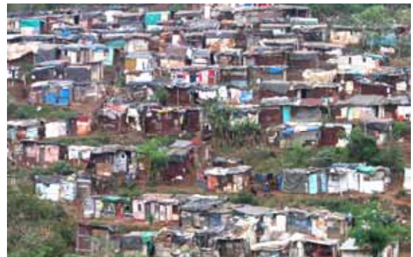
Cape Town - bidonville

L'ingresso a Cape Town è anche un pugno nello stomaco: una palizzata di cemento, lunga chilometri, fiancheggia la nazionale n° 2. Racchiude la township (bidonville): un agglomerato di povere baracche di lamiera e cartone, ammassate una all'altra.