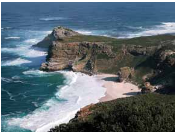
Capo di Buona Speranza

Non vi sono strade tracciate ma solo stretti sentieri fangosi che attraversano questo mondo di povertà, di violenza e di miseria.