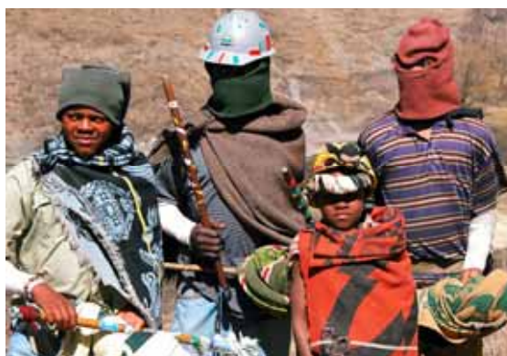
Lesotho - popolazione locale