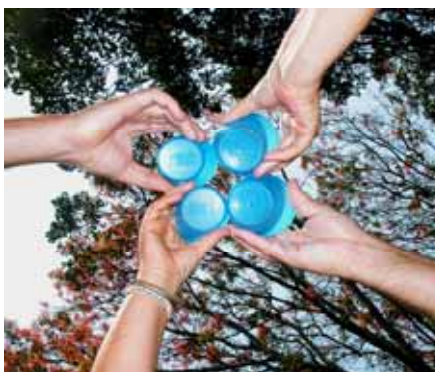
.....cin cin !

Otto mesi difficili da descrivere e anche, a tratti, da ricordare. Tante sono state le emozioni, tanti gli incontri e le domande che ci siamo poste. Impossibile fare un’ analisi di tutto il “visto e il vissuto” di questo viaggio, ma sicuramente è un’ esperienza che rimarrà in modo indelebile dentro di noi.