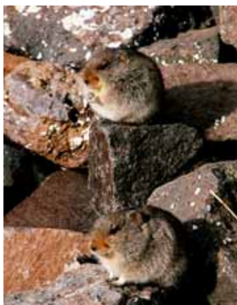
Topi del ghiaccio

Al mattino è tutto avvolto da una fitta nebbia. Facciamo dogana per rientrare in Sudafrica e iniziamo la ripidissima discesa sulla pista, permessa solo ai 4x4. Come d'incanto le nubi si dissolvono e lasciano intravedere un panorama selvaggio ed emozionante.