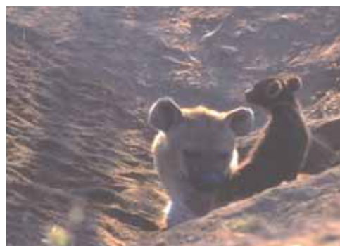
Iena la Mamma