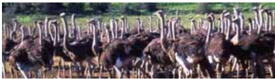
Gli struzzi di Oudtshoorn