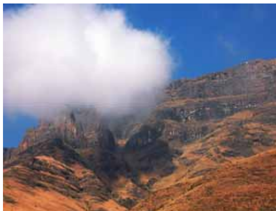
Montagne del Lesotho

La diga che forma la Dam di Katse, con i suoi 180