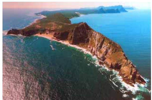
Penisola del Capo

Ma non si può parlare di apartheid senza ricordare Nelson Mandela, premio Nobel per la pace nel 1993. Nella tristemente nota Robben Island (al largo di Città del Capo), ha trascorso i suoi 26 anni di prigionia. L'isola è stata per molti uomini luogo di segregazione e di umiliazioni, ma anche fucina di pensieri, voglia di vivere e di libertà. E' qui che è continuato il movimento per l'uguaglianza tra le razze che ha portato Mandela, all'età di 76 anni, dalla prigionia alla presidenza della