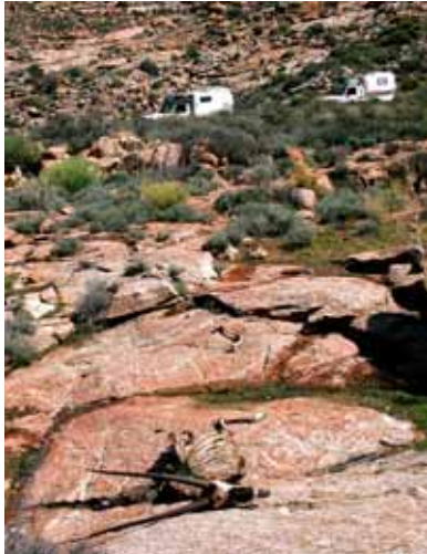
Resti di orice

E' una febbre che contagia tutti; con chiunque si parli l'unico argomento sono le sardine. Anche noi ci fermiamo ad aspettarle per una settimana. Purtroppo quest'anno, per la prima volta, a causa della temperatura troppo elevata dell'acqua, il fenomeno non si è verificato.