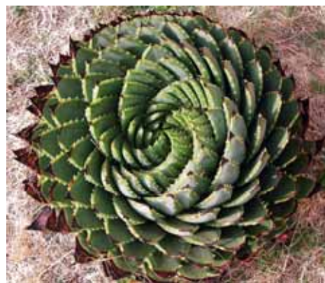
Aloe a spirale

Dormiamo a 3.000 metri nel parcheggio della Bokong Nature Reserve , affacciato a strapiombo su una profonda falesia. Il cielo sembra più vicino qui e la luminosità delle stelle, per la totale assenza di inquinamento, è altissima. Su queste montagne cresce un raro tipo di Aloe , pianta grassa endemica dalla forma insolita e particolare: le foglie dal centro verso l'esterno si aprono a formare una perfetta spirale. Ci inerpiciamo a fatica,