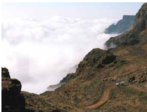
Discesa dal Sani Pass

rimanendo a lungo in quota, su di un tratto che ha fama di essere il luogo più freddo, arido e sperduto del Lesotho. Sembra di rivedere le immagini degli altipiani del Nepal e del Pakistan. Costeggiando il fiume Senqu dalle acque limpide e trasparenti, attraverso uno scenario aspro e spettacolare, arriviamo al Sani Pass (2.874 mt). Passiamo la notte in cima al passo mentre forti raffiche di vento scuotono violentemente le nostre cellule.