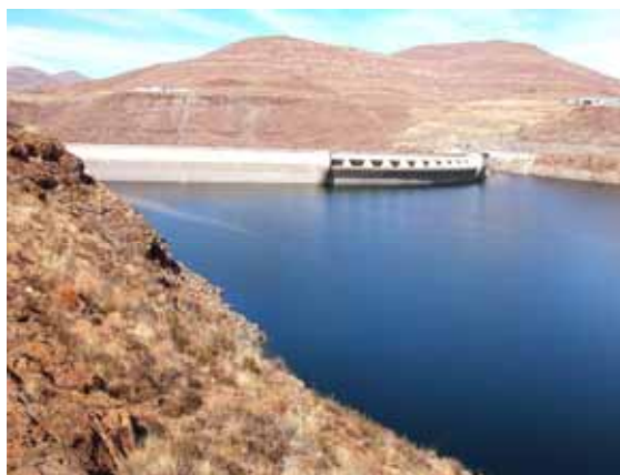
Katse Dam – la diga

metri di altezza, è una grande opera di ingegneria, nella cui costruzione gli Italiani hanno avuto un ruolo molto importante. Qui il ricordo lasciato dai nostri connazionali è ottimo, e forse anche per questo ci riservano una calorosa accoglienza. Ci invitano a visitare la diga (per noi fino ad oggi solo un muro di cemento) e invece al suo interno scopriamo chilometri di cunicoli e gallerie, disseminate di sensori e strumenti elettronici per il monitoraggio continuo della sua "salute".