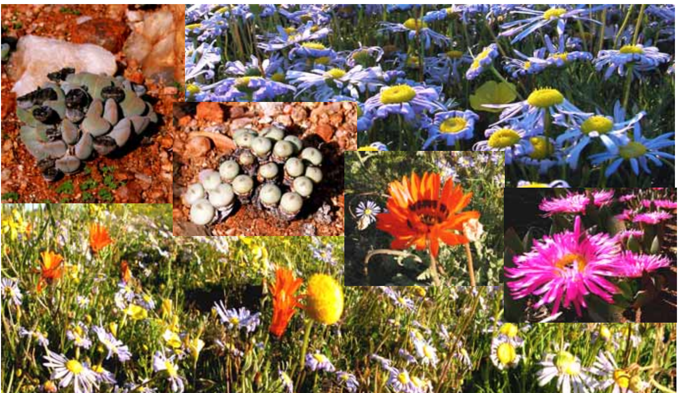
Fioritura nel Namaqualand

Ogni anno nel Namaqualand , o “giardino degli dei” come viene chiamato, in