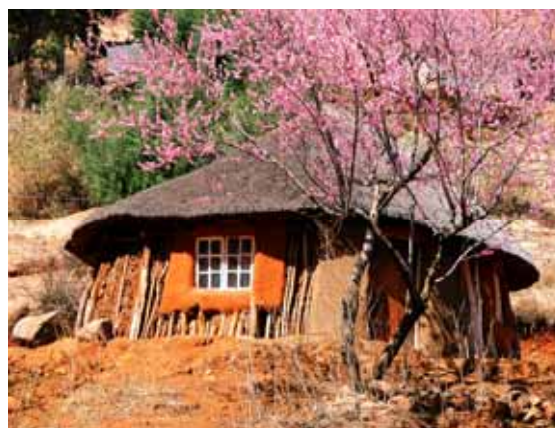
Peschi e capanne