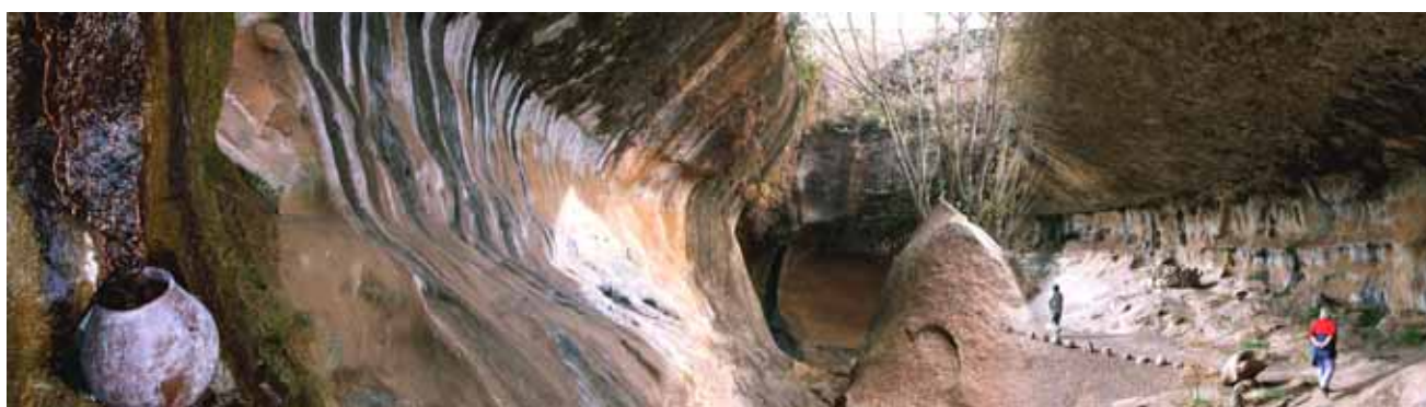
Lesotho – Liphofung Nature Reserve – pitture rupestri