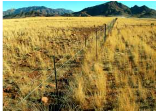
"Infinito" ... limitato

Lasciamo la Namibia con le sue sconfinite distese che dovrebbero dare un senso di infinito e di libertà. Invece tutto è "obbligato" "costretto" "delimitato". Migliaia di chilometri di recinzioni di filo spinato, che racchiudono apparentemente il nulla, percorrono tutto il paese e ti fanno sentire come avviluppato in una grande ragnatela.