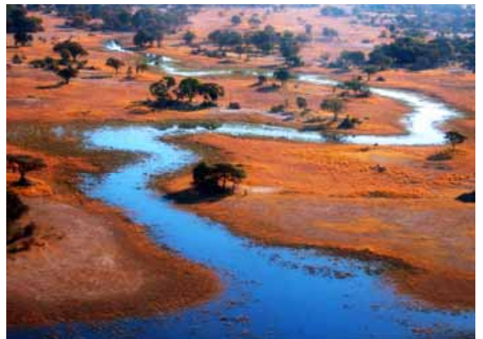
Okavango – veduta aerea