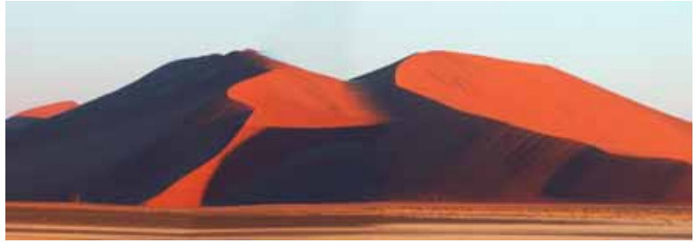
Deserto del Namib