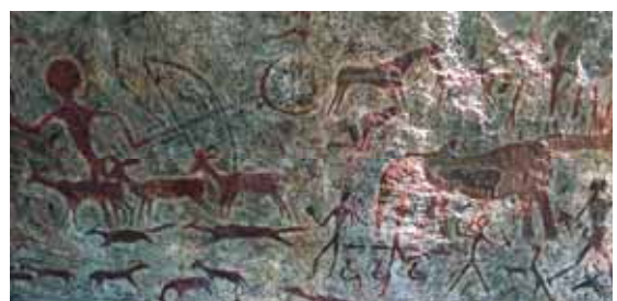
Spitzkoppe – pitture rupestri

Ai piedi della rupe due notti, due fuochi sotto una grande volta stellata: questo è lo Spitzkoppe.