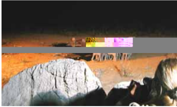
Etosha – Pozza illuminata

prima 7 elefanti e poi 4 rinoceronti. Due di loro si appartano e si scambiano effusioni muso contro muso, anzi corno contro corno, nel tentativo di compiere l'atto più antico del mondo... "l'amore". Purtroppo per loro il tutto si conclude con un nulla di fatto. Sul più bello vengono disturbati: quattro iene sbucando dal buio si avvicinano a bere e i rinoceronti rimangono a bocca asciutta e...scornati!