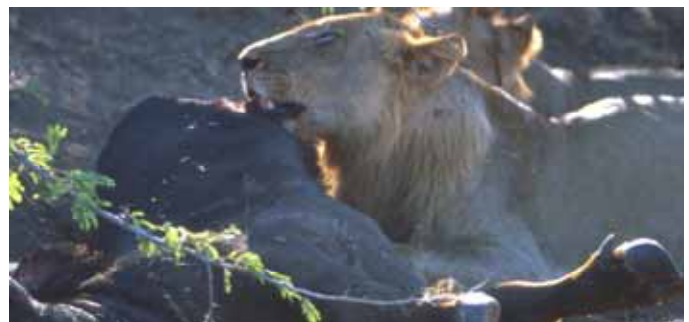
Il Re Leone

che attraversano il Savuti come due binari ci guidano per 400 km fino a Riserva Moremi e a Maun. La guida è impegnativa anche per gli esperti. Nonostante gli avvallamenti e le profonde buche, sulla sabbia molle è necessario tenere velocità sostenute e questo ti porta a frequenti derapate. E'