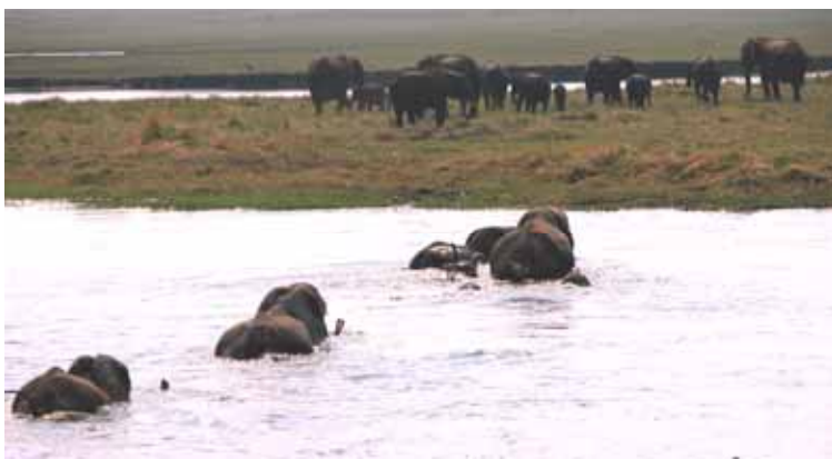
Botswana - Elefanti del Chobe

sentono odore di cibo. "Attila" si presenta da solo. Il fulvo facocero incurante di urla, pedate e bastonate si aggira arrogante nel campeggio facendo razzia di ogni genere commestibile. E gli elefanti... hanno diritto di precedenza al rubinetto dell'acqua!