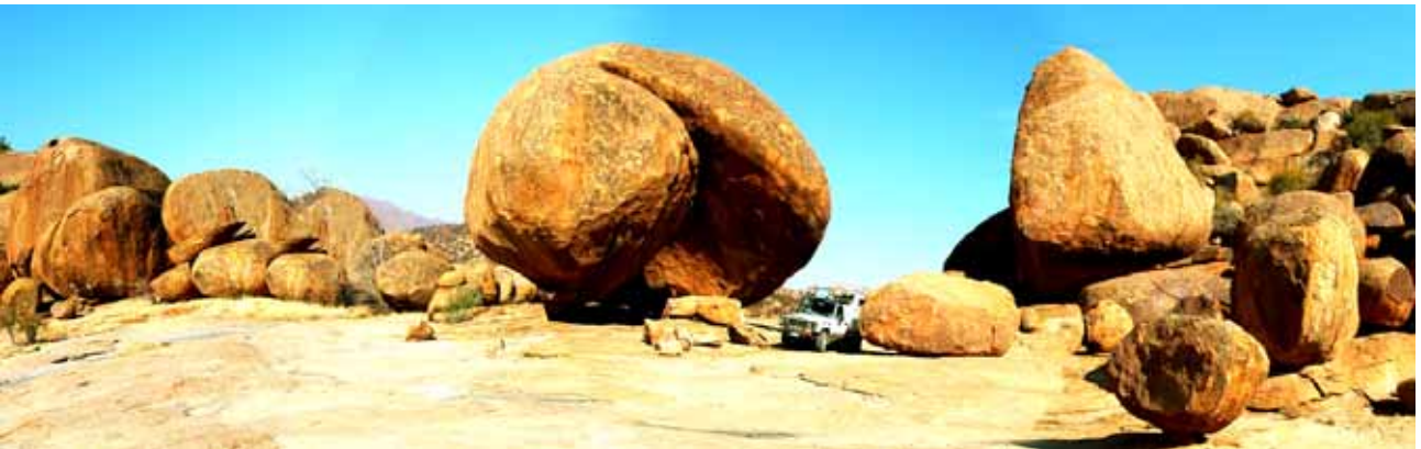
Magie dello Spitzkoppe

Spitzkoppe: un nome, un luogo, una montagna. Tra dedali di pietre e cunicoli, intercalati da baobab nani e acacie, enormi massi dalle forme bizzarre stanno in bilico, quasi sospesi nel vuoto.