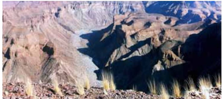
Fish River Canyon

Con una pista tra montagne da una parte e il Fish River Canyon dall'altra raggiungiamo Ai – Ais, in lingua nama “caldo che scotta”. L'oasi è incastonata sotto le vette del canyon, contornata da palme e tamerici. Piscina calda all'aperto e terme, luogo ideale per due giorni di relax. Non ci sembra vero, nella cucina comune ci sono ben tre forni.