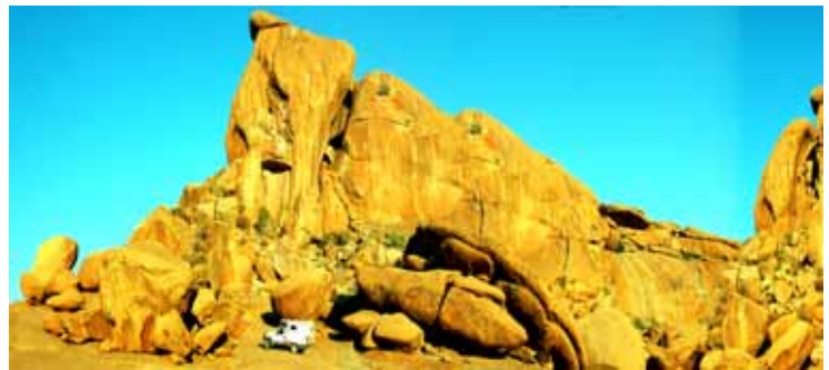
Namibia – formazioni rocciose

Lüderitz, cittadina in stile bavarese, si affaccia sulle gelide acque dell'oceano. Nelle vicinanze la città fantasma di Kolmanskop che ha visto il suo splendore agli inizi della corsa ai diamanti. Da qui si estende lo Sperrgebiet , zona rigorosamente inaccessibile perché diamantifera.