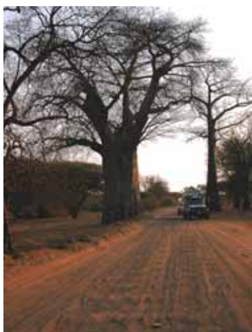
Savuti - la pista

facile rimanere insabbiati quando per cedere il passo devi