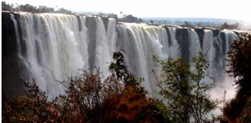
Zimbabwe – Cascate Vittoria

Visitiamo le Victoria Falls sul fiume Zambesi, che divide lo Zambia dallo Zimbabwe.