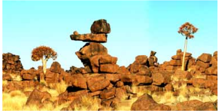
Giardino dei Giganti

Col nome di Giant's playground è indicata una delle bizzarrie della Namibia. Migliaia di macigni sono in bilico uno sull'altro, esempio degli sconvolgimenti geologici che ha subito questa terra.