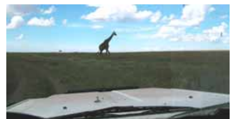
Etosha National Park